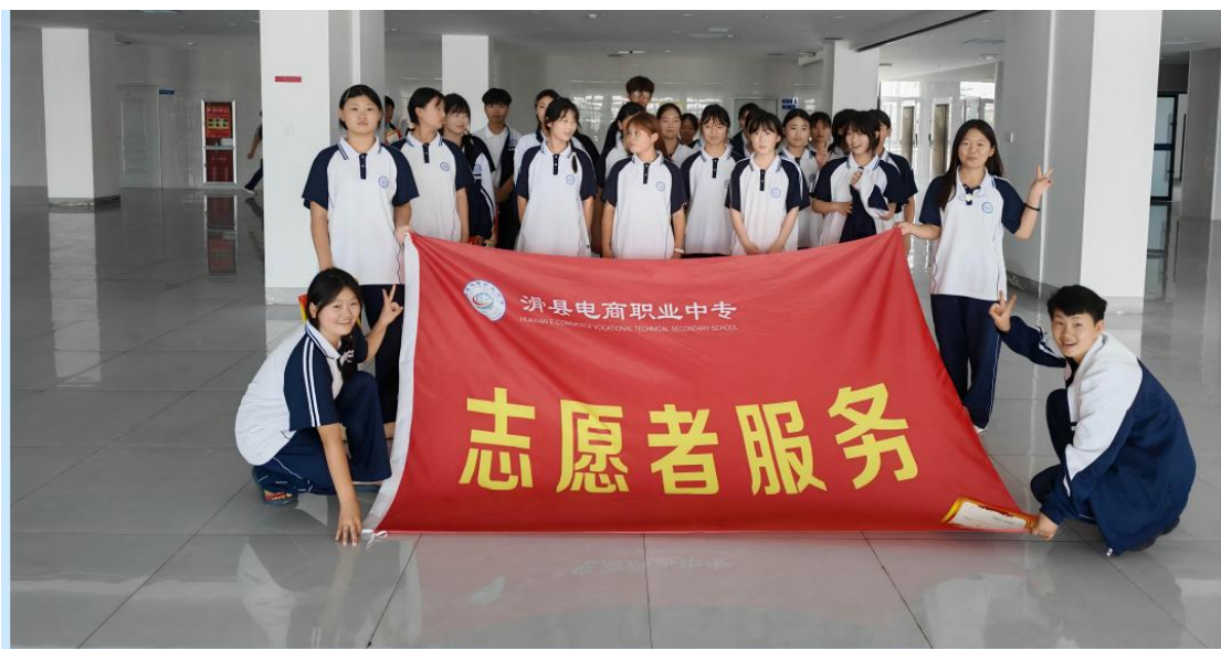
滑县电商职业中专学生自主管理-志愿服务班级值周

探索实施学生自主管理：随着社会的快速发展，学生的自主管理能力显得尤为重要，良好的自主管理能力不仅有助于学生学习专业知识，更是为今后的就业和深造打下了坚实的基础。学校通过组织学生自主管理实践周（班级轮换），提升了动手实践能力和管理综合素养，学生通过校园、寝室、食堂以及其他管理岗位的切身实践，清楚地认识到各项管理岗位的工作内容以及他们在学校生活中的重要性，从而提高了学生在校生活学习期间的自主管理意识，为他们将来就业创业及继续深造学习打下坚实的思想基础。