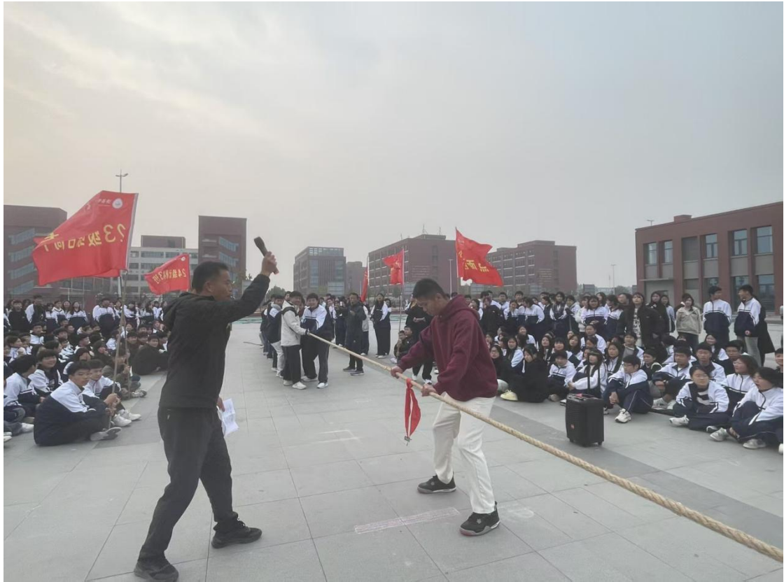
滑县电商职业中专 2024 年冬季拔河比赛