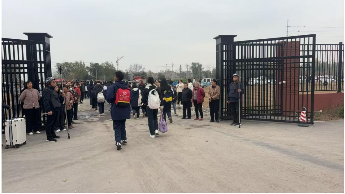
2024年11月14日，滑县电商职业中专领导护送学生安全离校