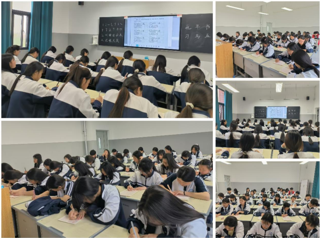
滑县电商职业中专硬笔书法社团