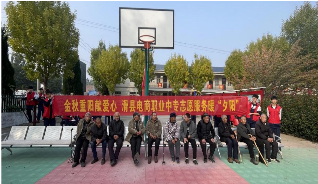
2024年重阳节，滑县电商职业中专志愿者到小铺乡敬老院志愿服务送温暖