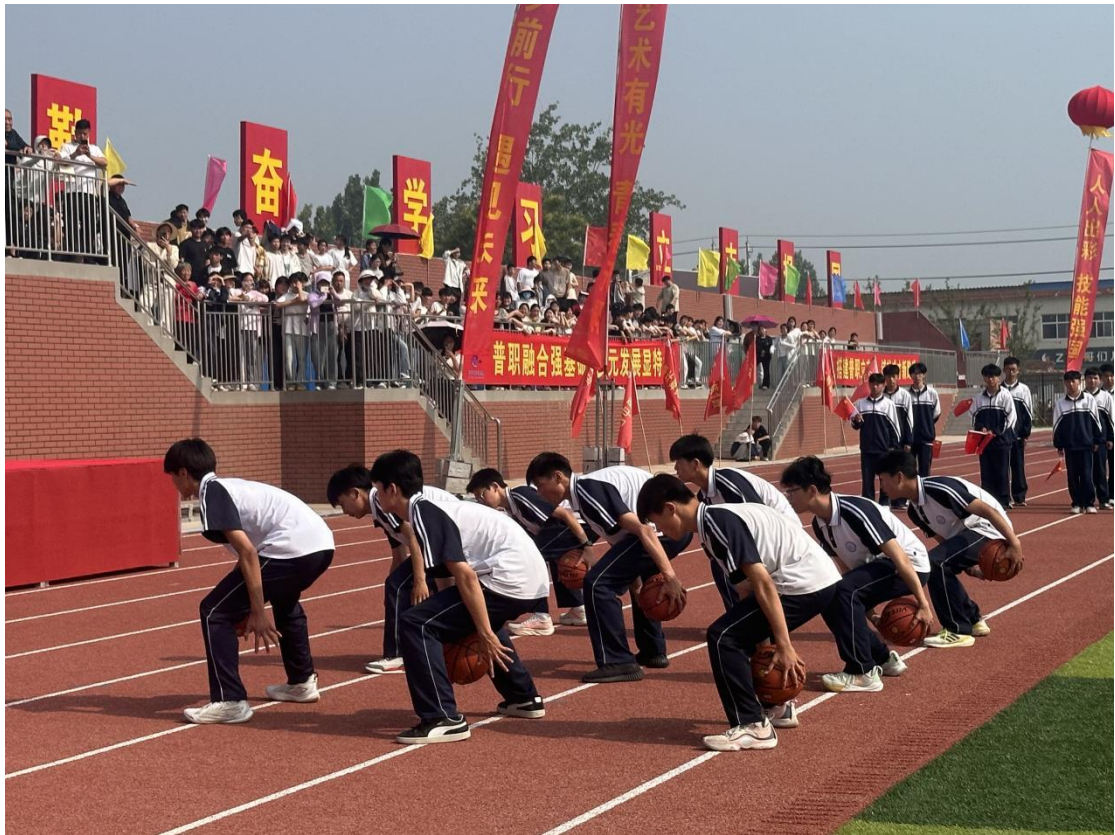
滑县电商职业中专篮球社团展示