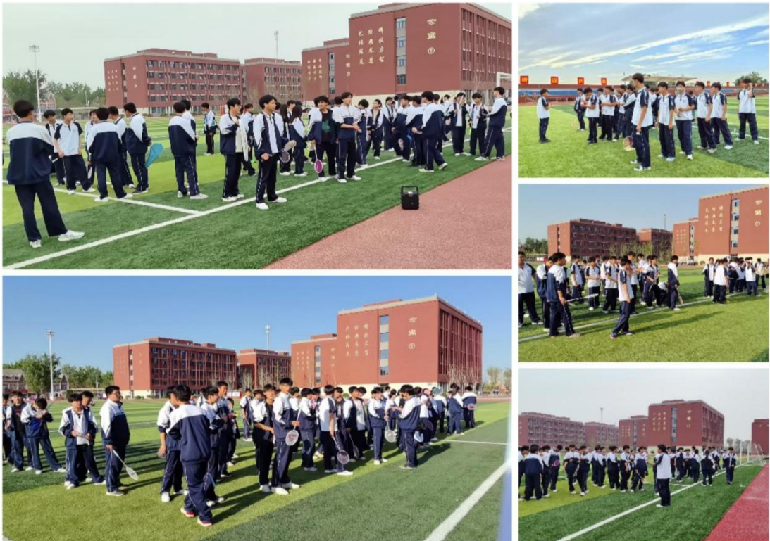
滑县电商职业中专羽毛球社团