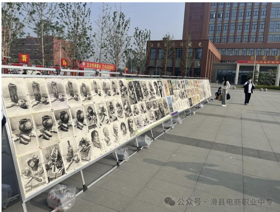
滑县电商职业中专美术社团作品展