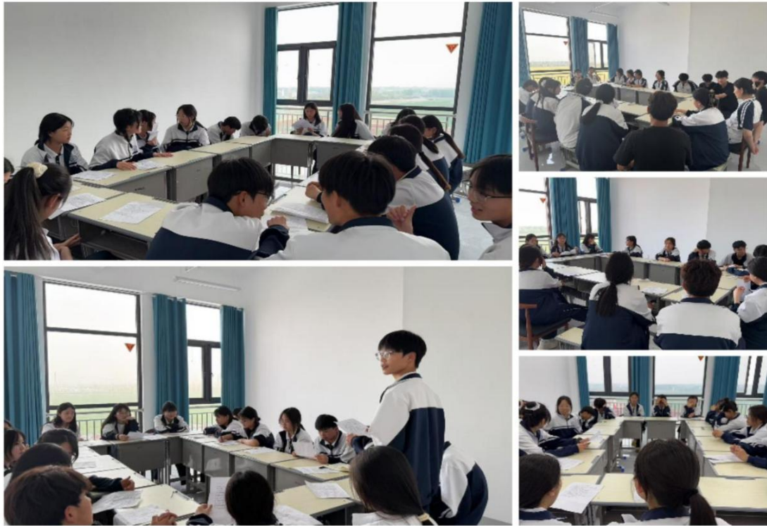
滑县电商职业中专播音主持社团