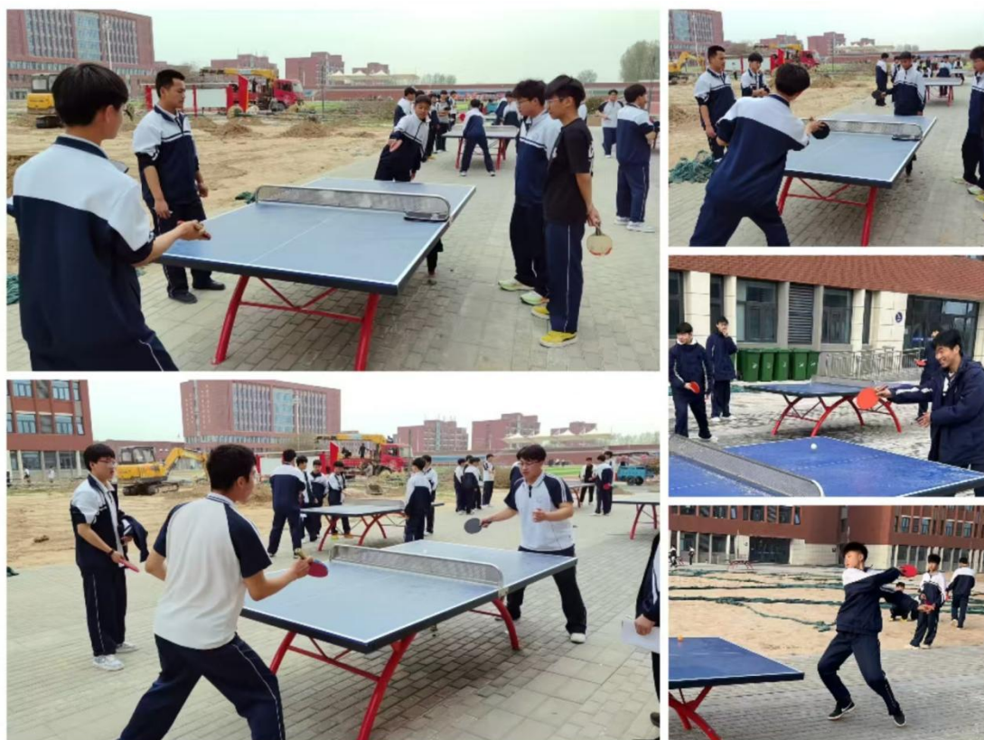
滑县电商职业中专乒乓球社团