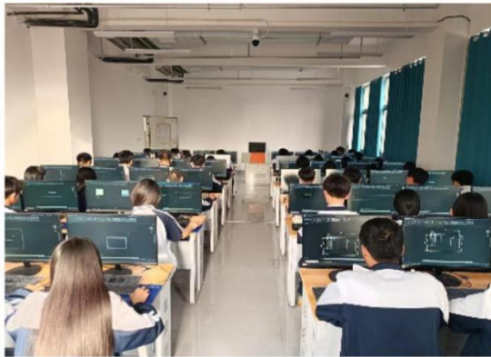
滑县电商职业中专计算机设计社团