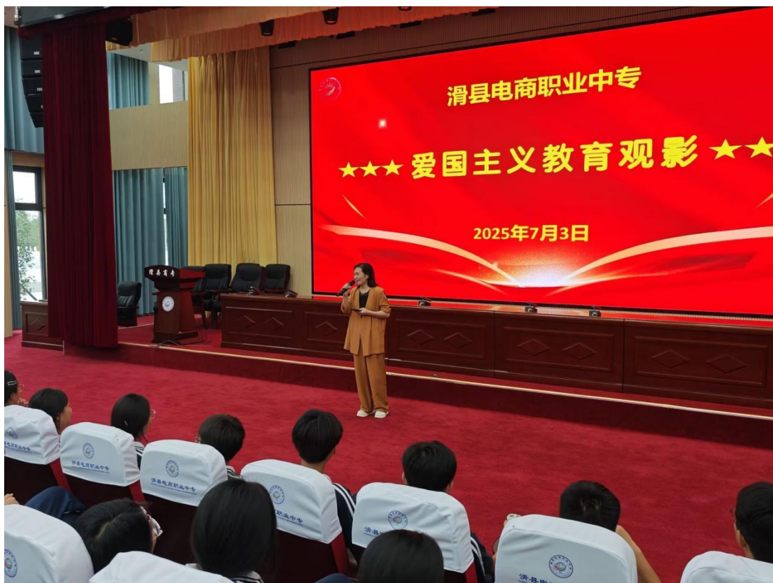
2025年7月3日，滑县电商职业中专组织学生观看爱国主义教育电影