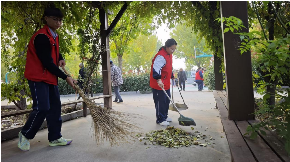
滑县电商职业中专志愿者为社区敬老院打扫卫生

职业教育助力乡村经济发展，学校在绿化、净化、美化乡村（学校所在地）环境中做出了积极努力和贡献。