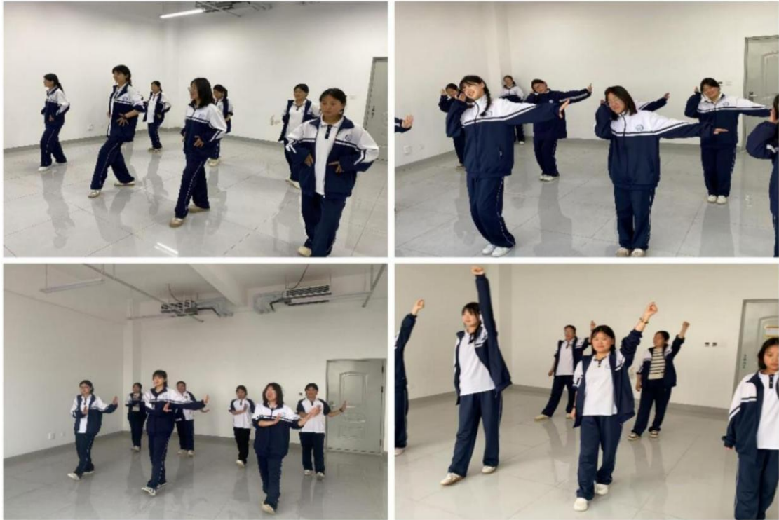
滑县电商职业中专舞蹈社团