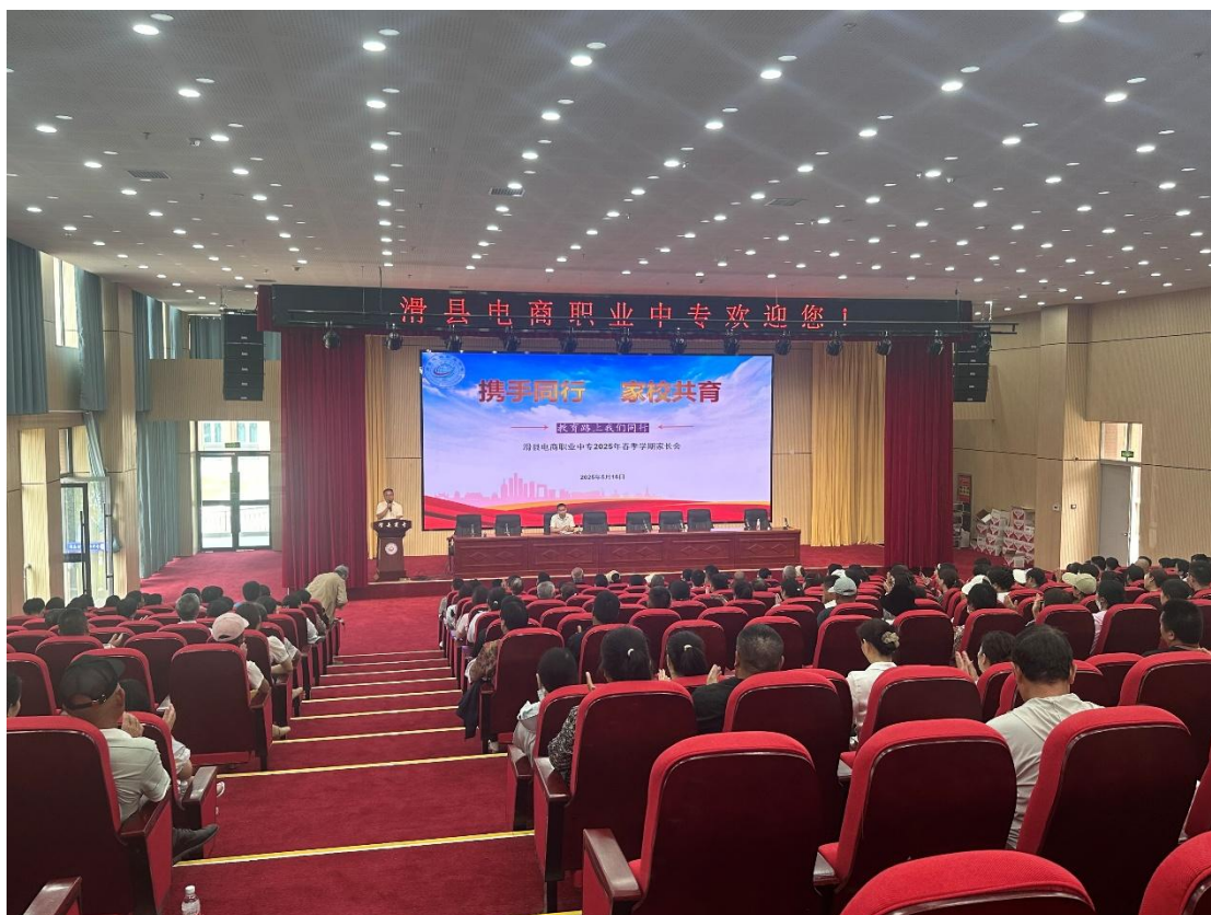
2025年5月16日，召开2025年春季学期家长会