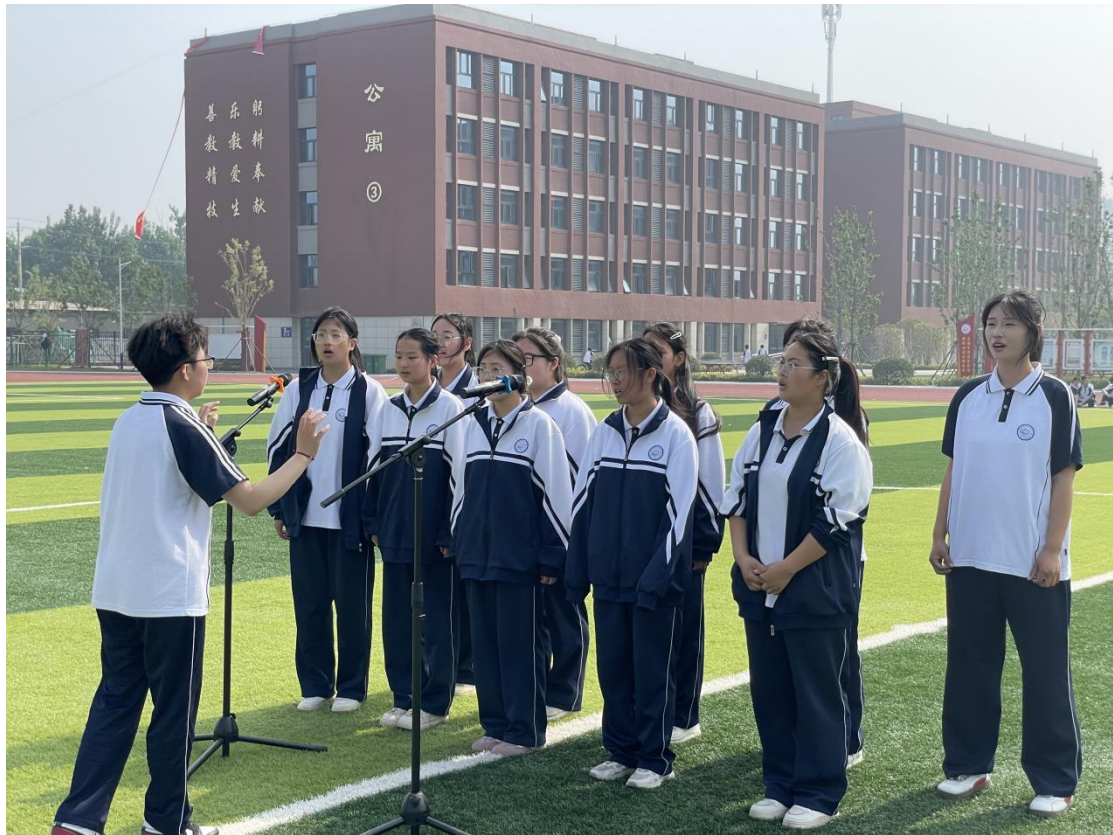
滑县电商职业中专声乐社团