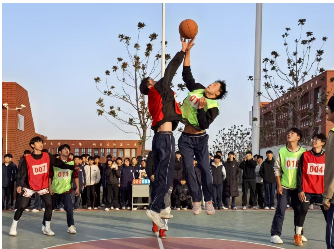
滑县电商职业中专 2024 年冬季篮球校园赛