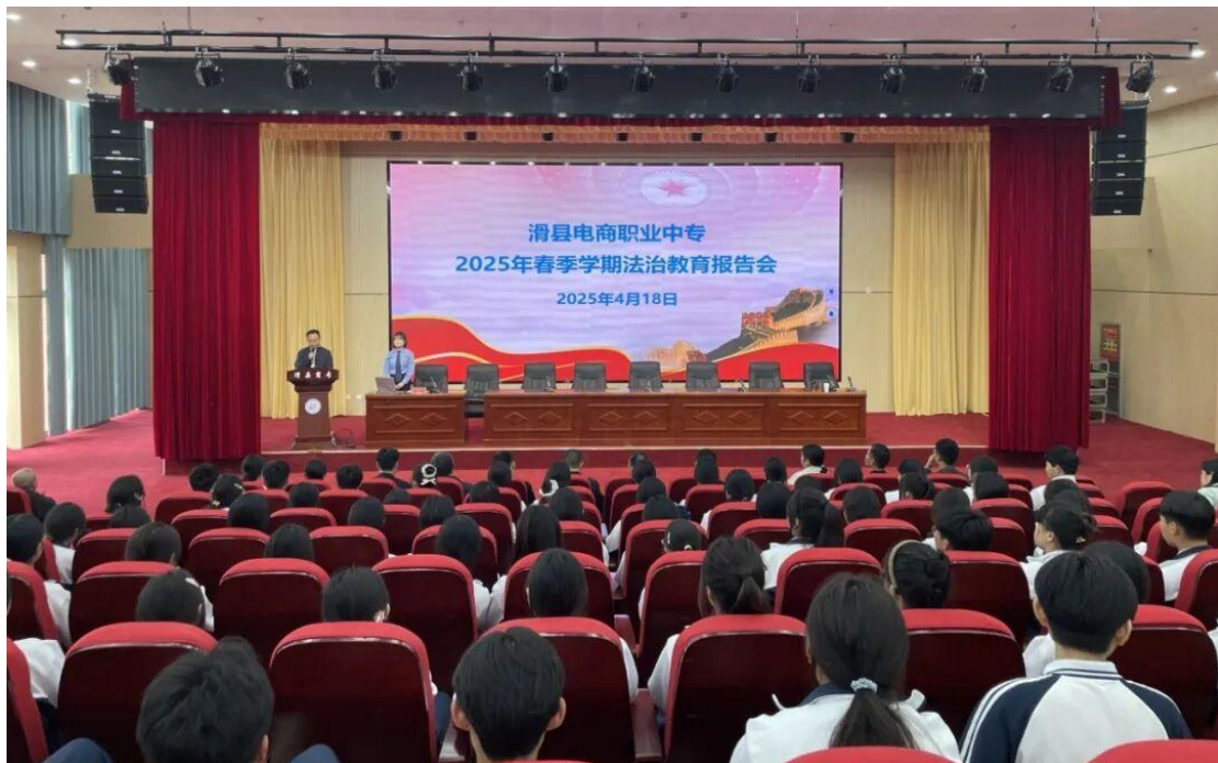
2025年4月18日，滑县电商职业中专春季学期法治教育报告会