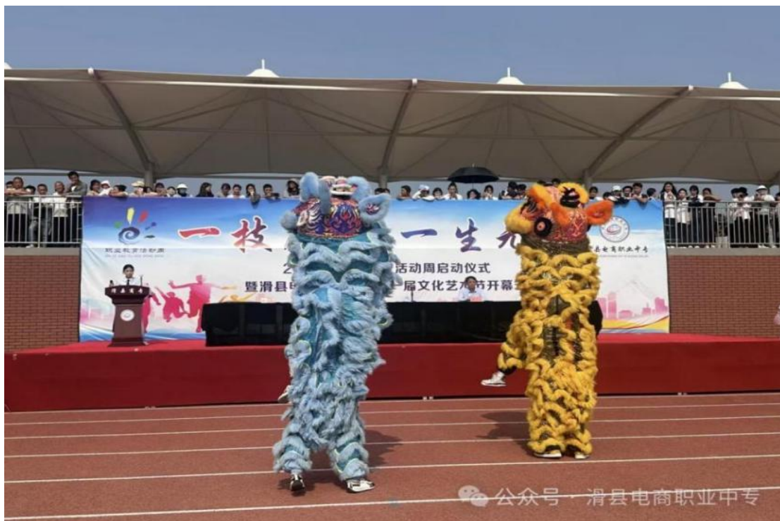
滑县电商职业中专舞狮社团