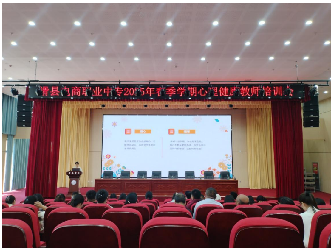
2025年4月22日，滑县电商职业中专开展春季学期心理健康教师培训