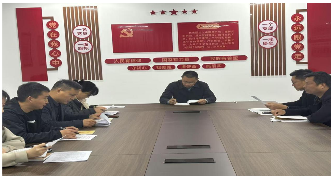
2025年3月23日，滑县电商职业中专在图文楼一楼党团活动室召开中央八项规定学习部署会议

学校始终坚持以学生为中心，围绕学生成长成才需求，开展党建活动，关心关爱学生学习生活，帮助学生解决实际困难。