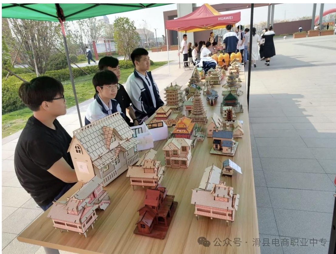
滑县电商职业中专手工社团作品展