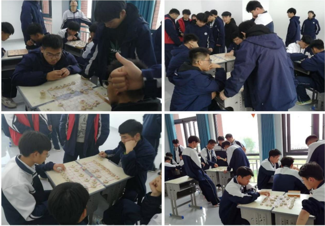
滑县电商职业中专象棋社团