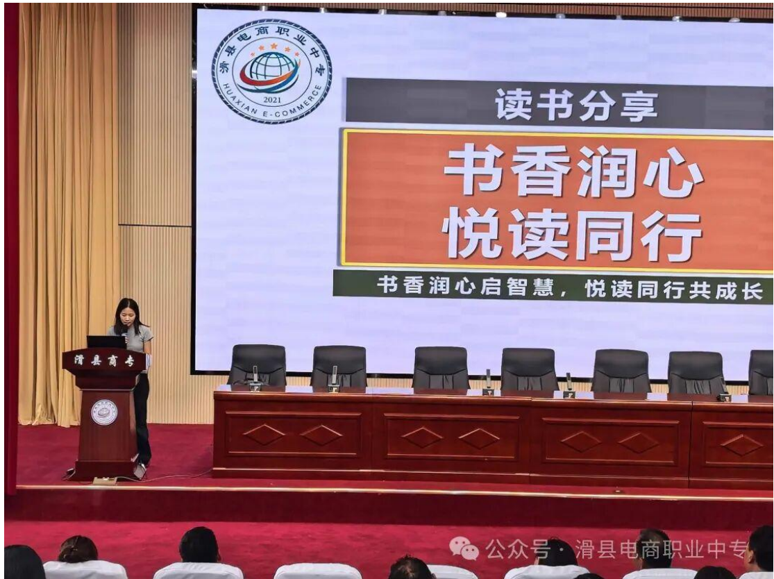
2025年6月30日，滑县电商职业中专举行教师读书分享会