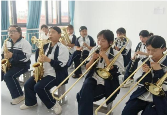
滑县电商职业中专器乐社团